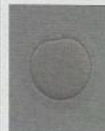
Begehrtes Gut – die Eizelle: Bei einer 25-Jährigen reifen unter Hormonstimulation bis zu 30 Stück pro Zyklus heran. Mit zunehmendem Alter verringert sich die Ausbeute